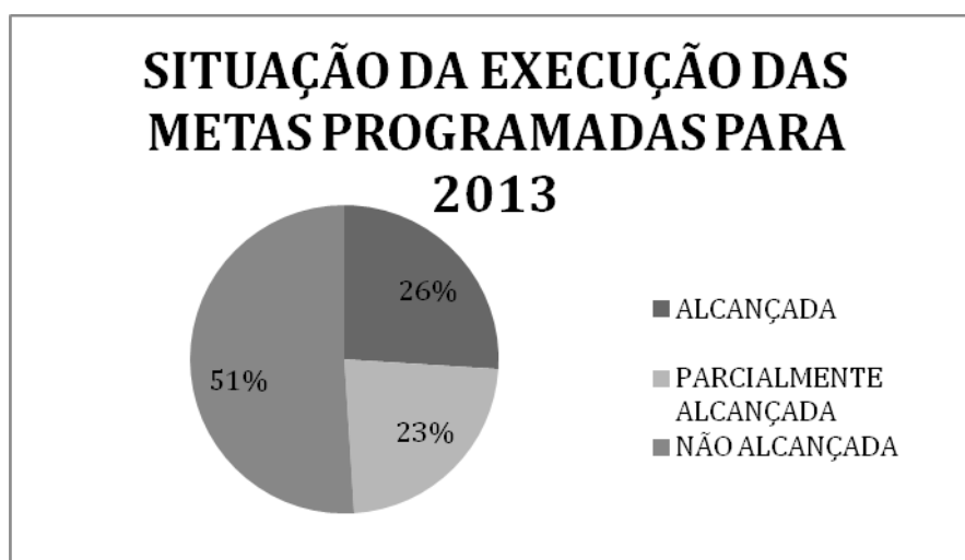
Figura 1 – Situação da execução das metas programadas para 2013

Na análise realizada pelo GT-Revisão, das 35 metas programadas, designadas como de curto prazo, 26% foram cumpridas, 23% foram parcialmente cumpridas e 51% não foram cumpridas, conforme é mostrado no Figura 1.